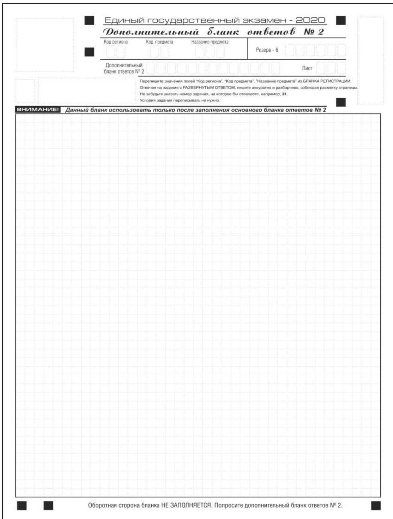
Рис. 15. Дополнительный бланк ответов № 2